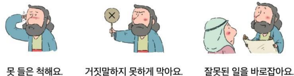
못 들은 척해요. 거짓말하지 못하게 막아요. 잘못된 일을 바로잡아요.

교회 안에서 잘못된 것을 가르치는 사람이 있으면 어떻게 해야 할까요? 알맞은 것에 모두 O표 하세요(11,13절).